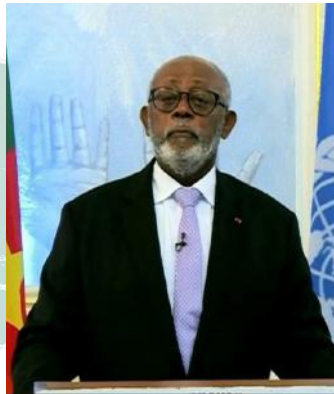
Lejeune MBELLA MBELLA Ministre des Relations Extérieures