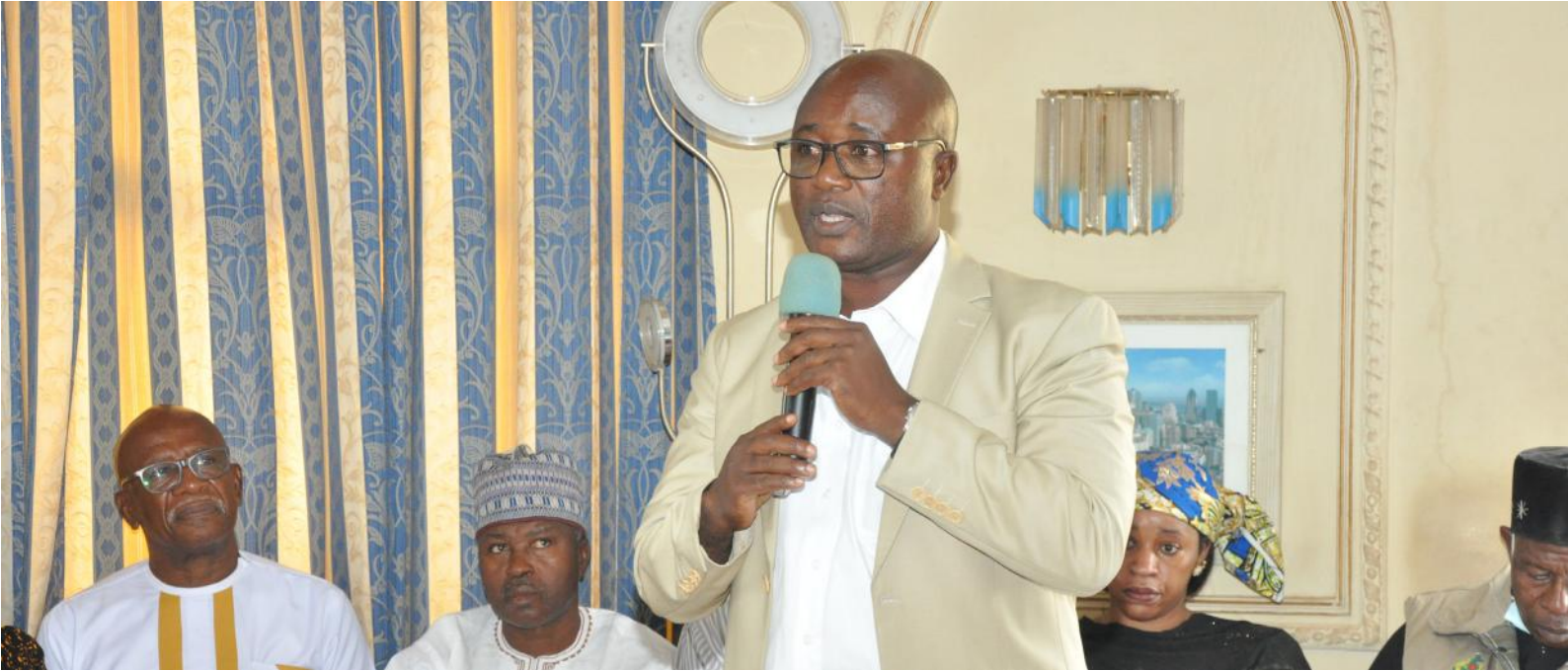
Mot du Coordonnateur National de JVF-Cameroun à l'occasion de l'ouverture officielle du forum.