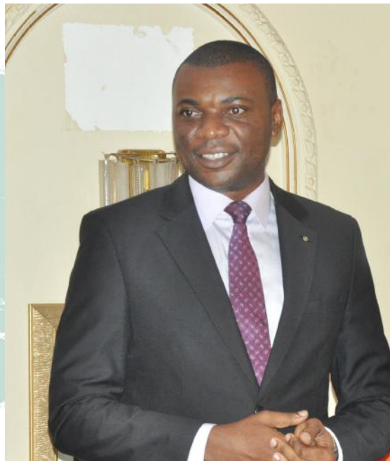
Yannick AYISSI Maire de la Commune d'Arrondissement de Yaoundé II