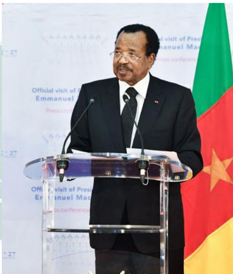
S.E Paul BIYA Président de la République