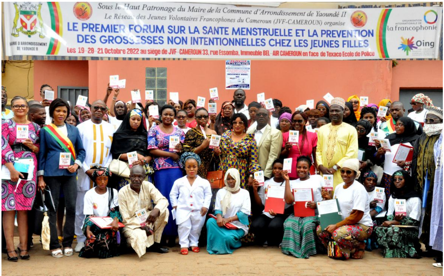
Photos de famille des cérémonies d'ouverture et de clôture du premier forum communal sur la santé menstruelle.