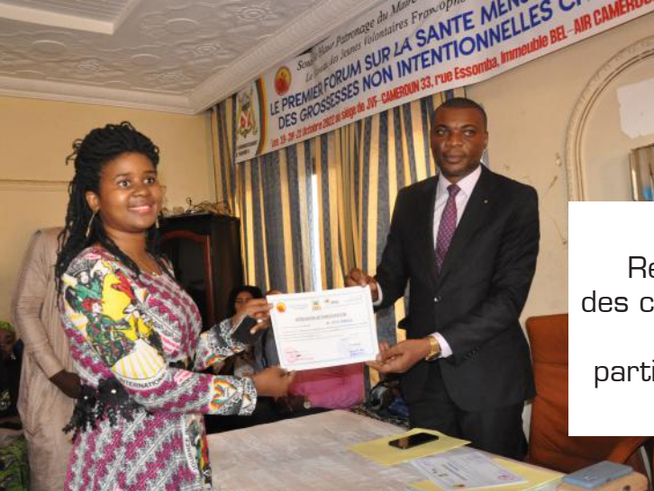
Remise des certificats de participation