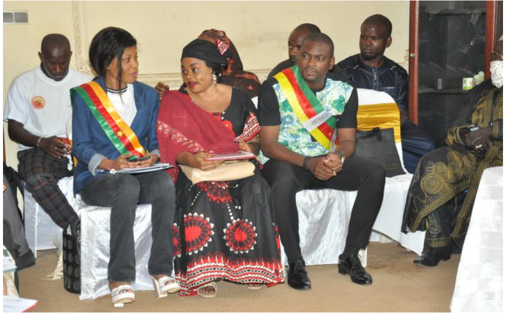
Mot de Madame le Maire Adjoint de la commune d'arrondisse- ment de Yaoundé 2 à l'occasion de la cérémonie d'ouverture du forum.