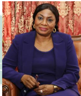
Pauline Irène NGUENE Ministre des Affaires Sociales