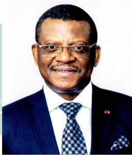
DION NGUTE Joseph Premier Ministre, Chef du Gouvernement