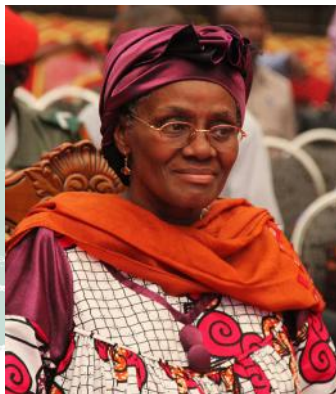
Pr Marie Thérèse ABENA ONDOA Ministre de la Promotion de la Femme et de la Famille