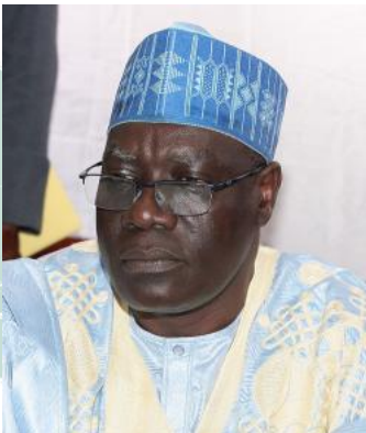
MOUNOUNA FOUTSOU Ministre de la Jeunesse et de l'Education Civique